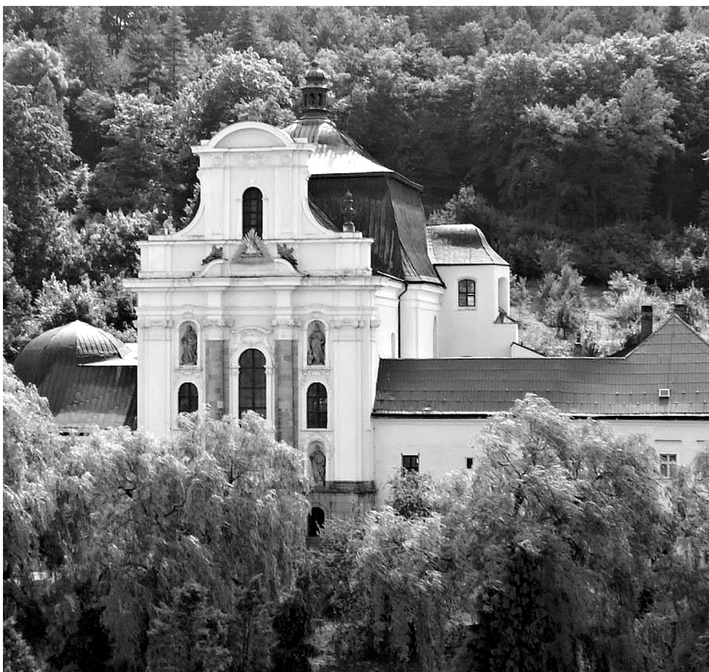
Jubilejní chrám - Farní kostel Nejsvětější Trojice ve Fulneku